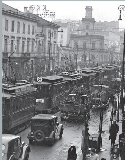
Komunikacja na ulicy Marszałkowskiej. Traffic on Marszałkowska Street. Verkehr in der Marszałkowska Straße.

Marszałkowska Street is the main historic thoroughfare of the city. In the middle of 19th century the Warsaw-Vienna Railway Station was constructed here and at the beginning of 20th century – the first electric streetcar started running here. After World War II the corner of Marszałkowska Street and Jerozolimskie Avenue became the main transport hub and Marszałkowska Street – a busy pedestrian route.