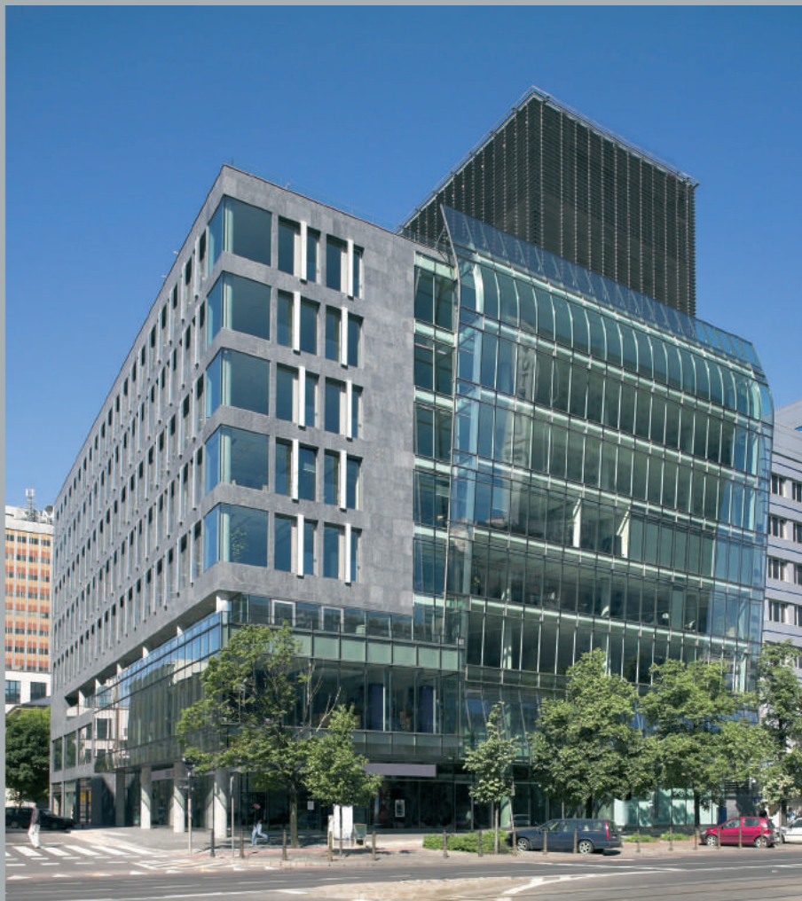
Fasada od ulicy Marszałkowskiej. Marszałkowska Street façade. Fassade von der Marszałkowska Straße aus.