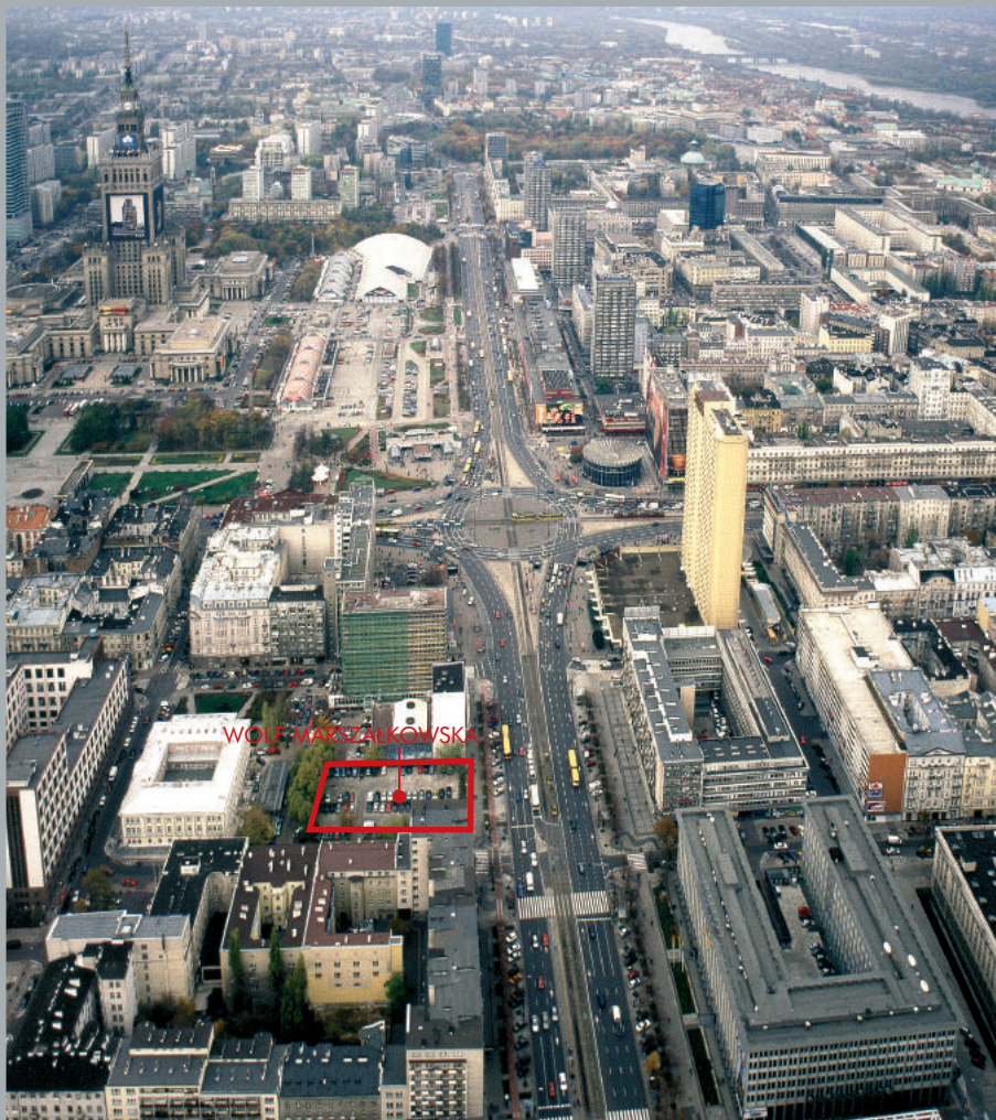
Najbliższa okolica z lotu ptaka. Bird's eye view of the neighborhood. Nächste Umgebung aus der Vogelperspektive.

Das Büro- und Geschäftshaus Wolf Marszałkowska ist im engen Zentrum Warschaus, an der Kreuzung der Hauptverkehrsarterien – Marszałkowska Straße und Allee Jerozolimskie gelegen. Die Lage ermöglicht eine schnelle Verbindung per Bus-, Straßenbahnlinien, U-Bahn oder mit der Bahn mit den weitestferntesten Stadtteilen Warschaus und seiner Umgebung. Die nahe Nachbarschaft vieler Objekte der Staatsverwaltung, von Finanz-Bank-institutionen, Hotels und Prestige-geschäften begünstigt die Situierung renommierter Büros und Geschäfte.