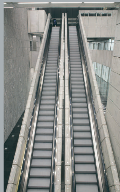
Schody ruchome. Escalator. Rolltreppe.