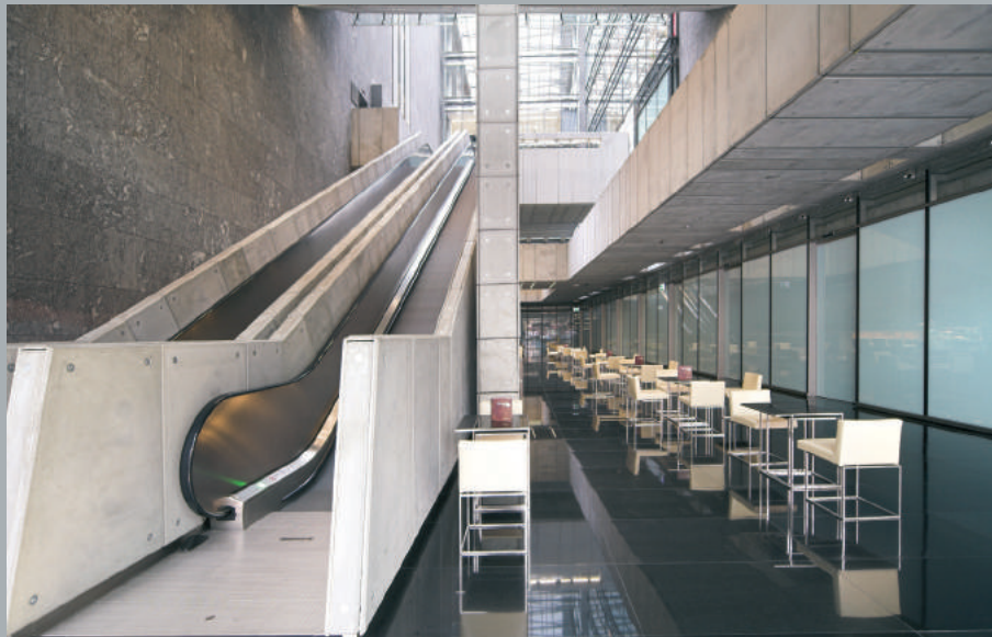
Kawiarnia w atrium. Coffee shop in the atrium. Kaffeehaus im Atrium.