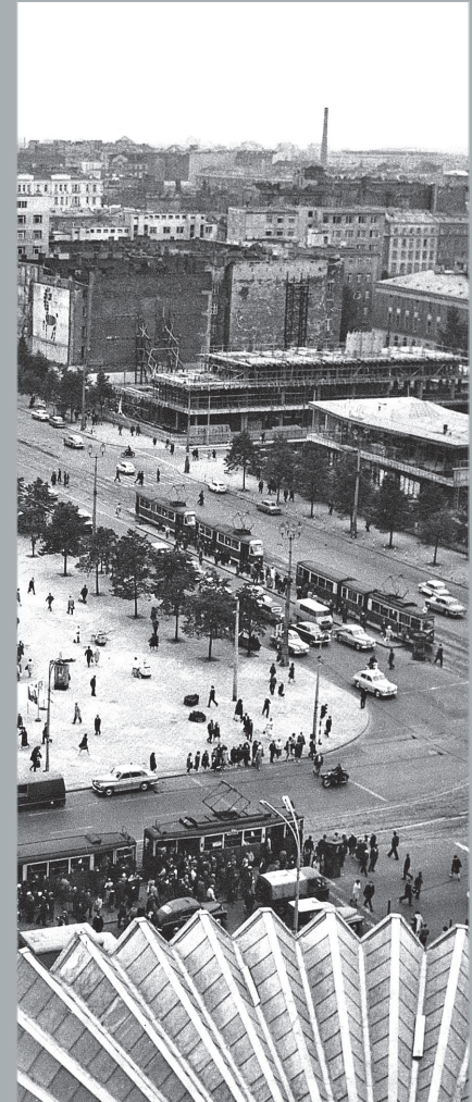
Główne skrzyżowanie Warszawy. Main hub of Warsaw. Hauptkreuzung von Warschau.