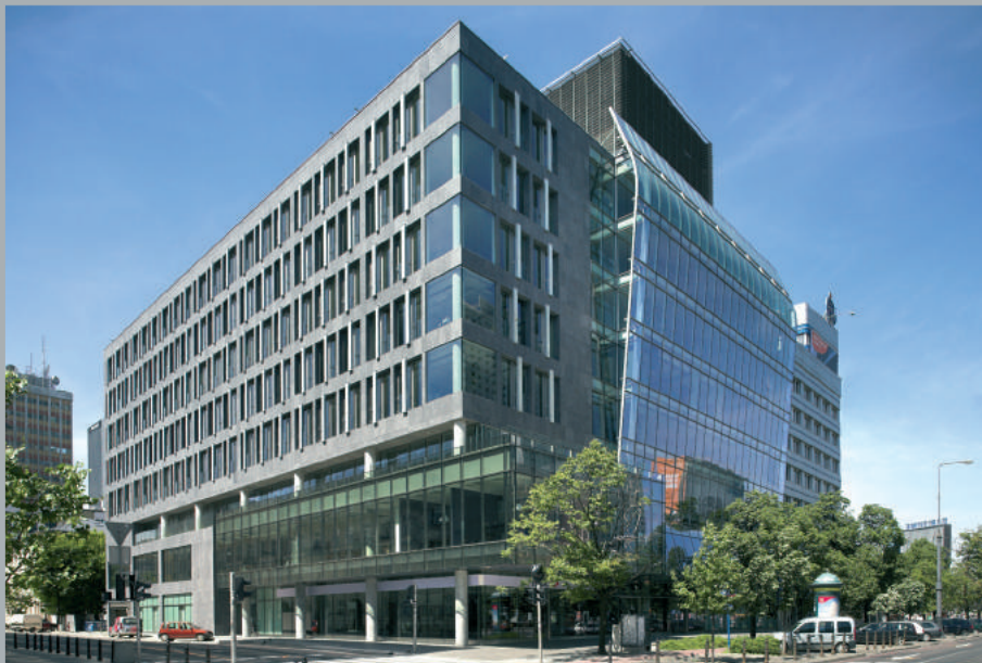
Widok od ulicy Marszałkowskiej. View from Marszałkowska Street. Ansicht von der Marszałkowska Straße aus.