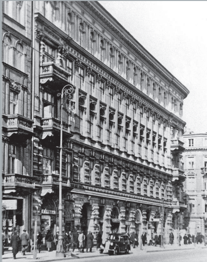
Kamienica przy ulicy Nowogrodzkiej. Apartment house on Nowogrodzka Street. Wohnhaus in der Nowogrodzka Straße.

Ulica Marszałkowska jest główną historyczną arterią miasta. W połowie XIX wieku usytuowano tu Dworzec Drogi Żelaznej Warszawsko-Wiedeńskiej, zaś na początku XX wieku wprowadzono pierwszą linię tramwaju elektrycznego. Po II wojnie światowej skrzyżowanie ulicy Marszałkowskiej i Alei Jerozolimskich stało się głównym węzłem komunikacji miejskiej, a ulica Marszałkowska – ruchliwym traktem pieszym.