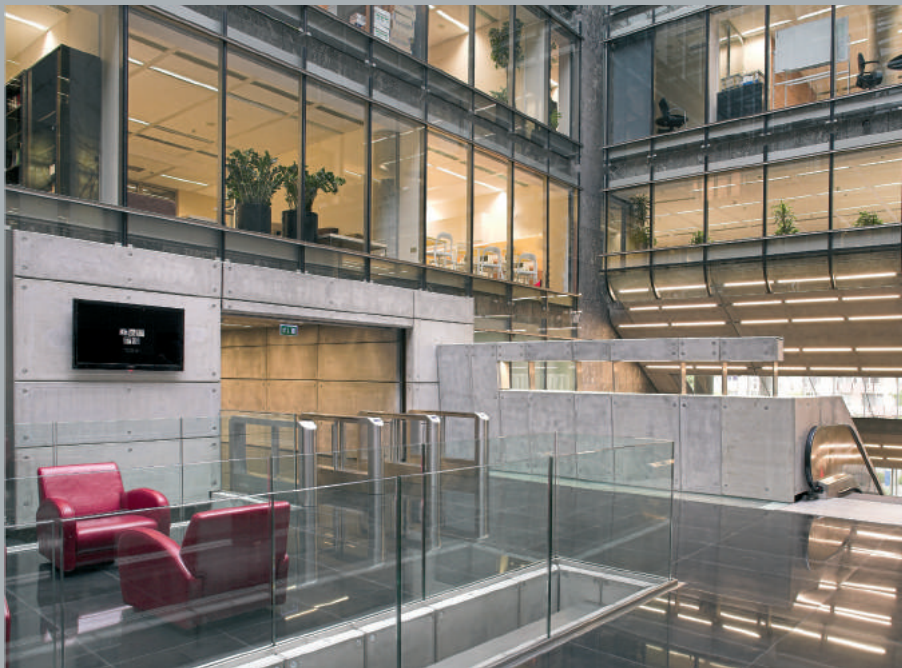
Hol biurowy i recepcja. Office entrance hall and the reception desk. Bürohalle und Rezeption.