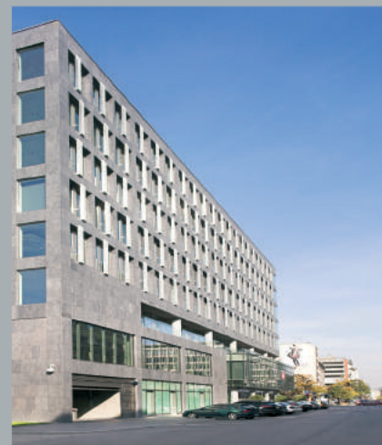
Widok od ulicy Żurawiej. View from Żurawia Street. Ansicht von der Żurawia Straße aus.