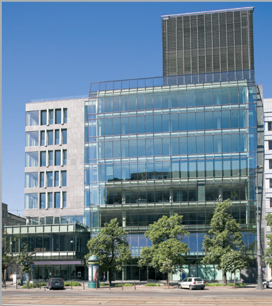
Widok od ulicy Marszałkowskiej. View from Marszałkowska Street. Ansicht von der Marszałkowska Straße aus.

Die Marszałkowska Straße ist die historische Hauptarterie der Stadt. Zur Hälfte des XIX. Jahrhunderts wurde hier der Bahnhof der Eisenbahnstrecke Warschau-Wien errichtet. Anfang des XX. Jahrhunderts verlief hier die erste Linie der Elektrostraßenbahn. Nach dem II. Weltkrieg wurde die Kreuzung der Marszałkowska Straße mit der Allee Jerozolimskie zum Hauptknotenpunkt des Stadtverkehrs und die Marszałkowska Straße – zum belebten Fußgängertrakt.