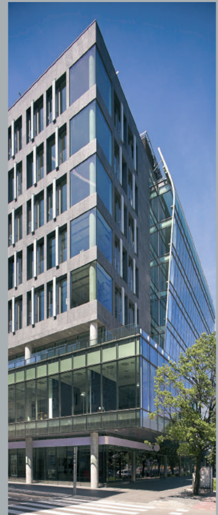
Widok od ulicy Marszałkowskiej. View from Marszałkowska Street. Ansicht von der Marszałkowska Straße aus.