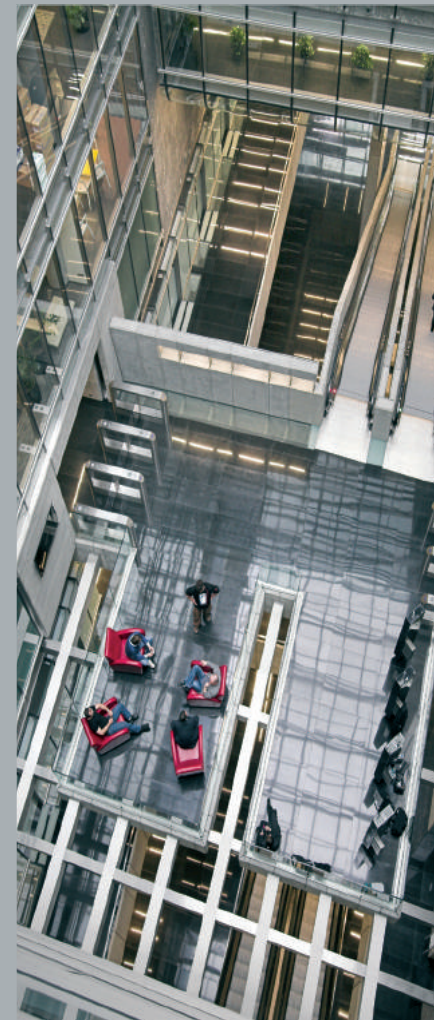
Widok atrium z góry. View of the atrium from above. Ansicht des Atriums von oben.