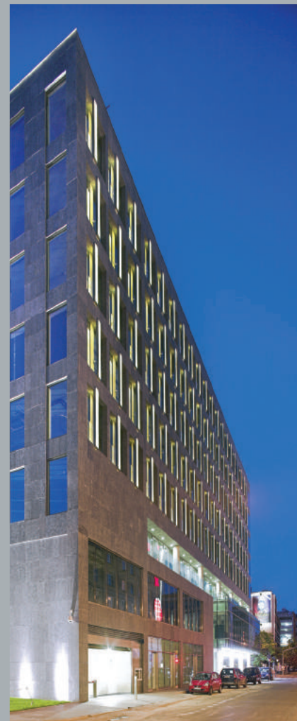
Narożnik od ulicy Żurawiej. Corner viewed from Żurawia Street. Ecke von der Żurawia Straße aus.