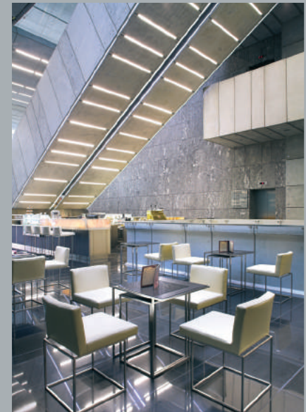
Kawiarnia w atrium. Coffee shop in the atrium. Kaffeehaus im Atrium.

Das verglaste Erdgeschoss des Gebäudes lädt Passanten in die Handelspassage ein, welche die Straßen Marszałkowska und Żurawia verbindet. Attraktive Dienstleistungsflächen befinden sich in den untersten Etagen des Gebäudes. Rolltreppen verbinden das Erdgeschoss mit der Bürohalle, die sich im zweiten Obergeschoss des Atrium befindet. Moderne, elegante Büroräume sichern den höchsten Arbeitskomfort.