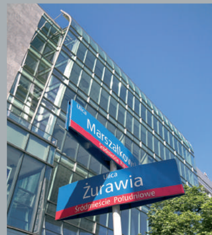
Fragment fasady od ulicy Marszałkowskiej Fragment of Marszałkowska Street façade. Fragment der Fassade von der Marszałkowska Straße aus.