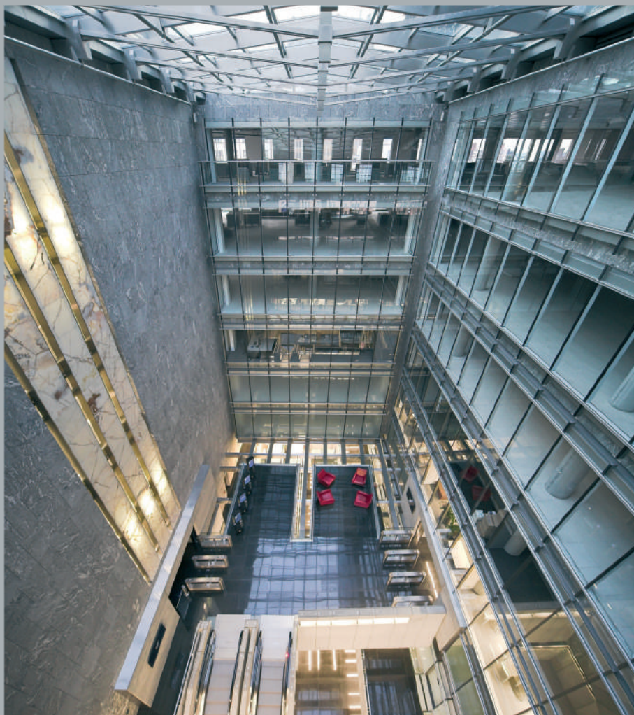
Widok biur. Offices. Büroansicht.