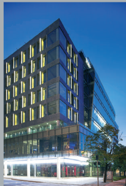
Naróżnik od ulicy Marszałkowskiej. Corner viewed from Marszałkowska Street. Ecke von der Marszałkowska Straße aus.