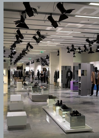
Otwarta przestrzeń handlowa. Open plan shopping area. Offene Handelsfläche.

Das verglaste Erdgeschoss des Warenhauses lädt Passanten zum Eintritt ein. Die Handelsetagen sind mit Zügen von Rolltreppen und Liften verbunden. Die verwendeten technischen Lösungen ermöglichen ein freies Arrangement der Dienstleistungsräume. Auf drei Stockwerken befinden sich Handelsflächen. Eine zusätzliche Attraktion ist das Bio-Regenerationszentrum und Restaurant, das sich in den obersten Etagen befindet.