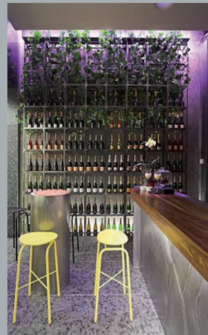
Champagne Bar. Champagne Bar. Champagne Bar.