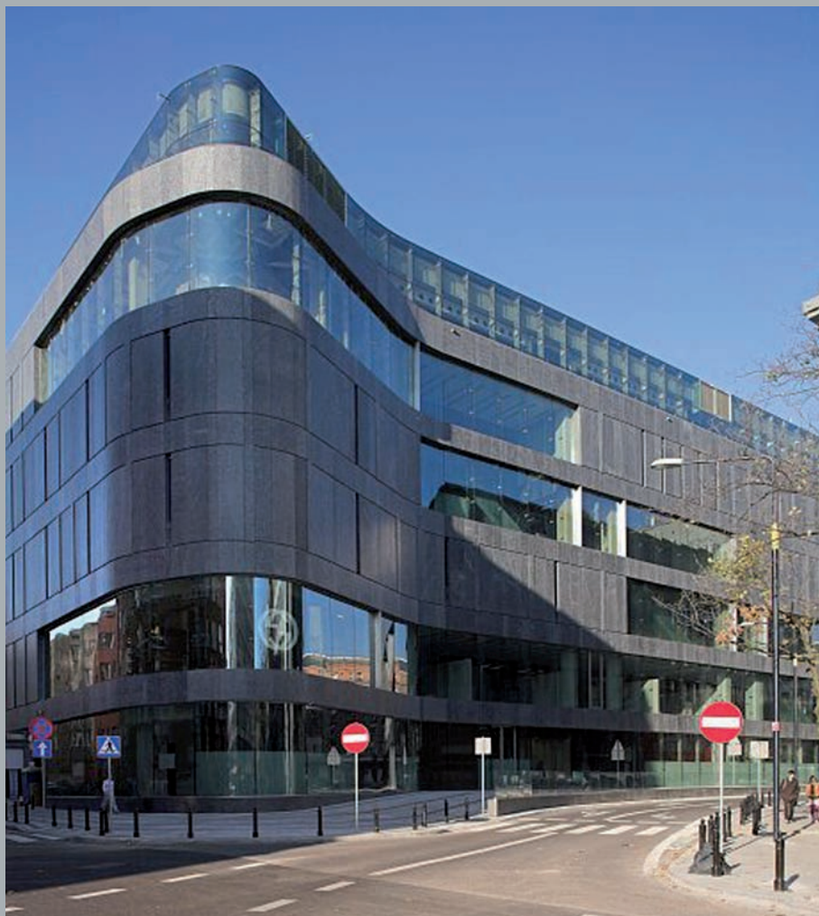
Widok od ulicy Brackiej. View from Bracka Street. Ansicht vom der Bracka Straße aus.