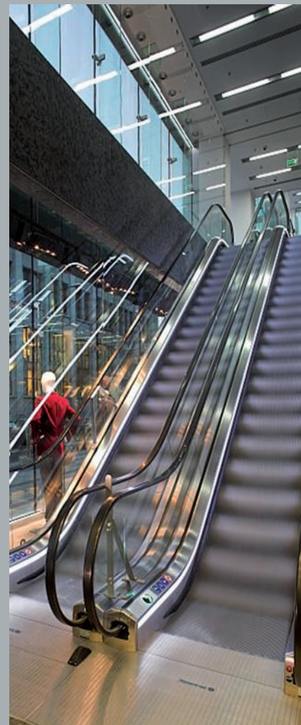
Schody ruchome łączą kondygnacje handlowe. Escalators connect the shopping floors. Rolltreppen, die die Handelsetagen verbinden.