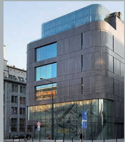
Widok od Alei Jerozolimskich. View from jerozolimski Avenue. Ansicht von der Allee Jerozolimskie aus.