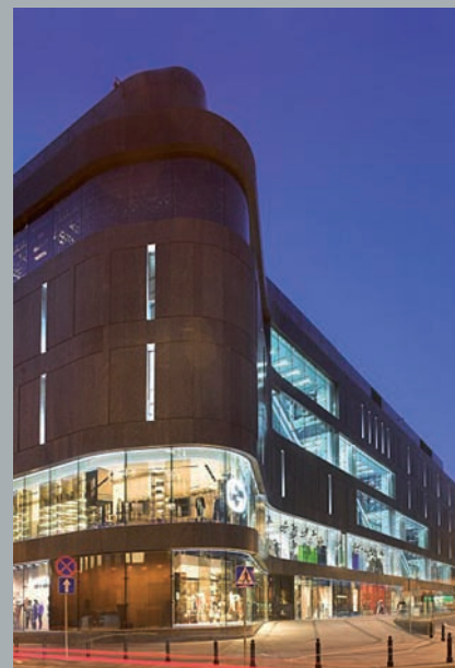
Fasada od ulicy Brackiej. Bracka Street façade. Fassade von der Bracka Straße aus.