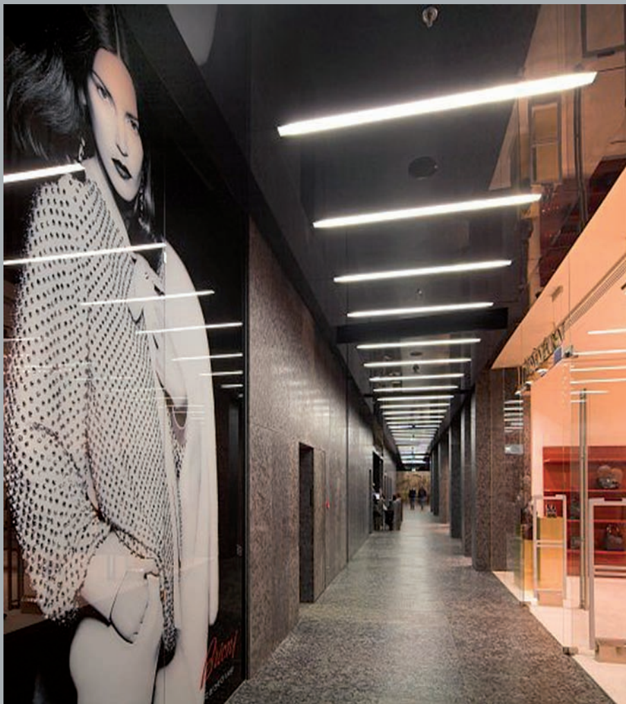
Hol na parterze. Hall on the ground floor. Halle im Erdgeschoss.