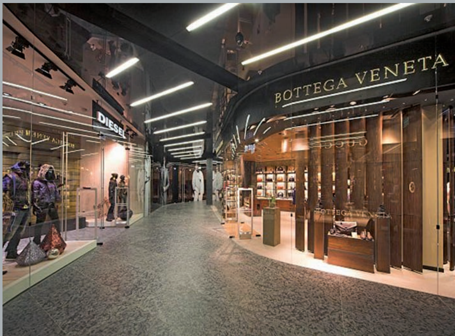
Hol na parterze. Hall on the ground floor. Halle im Erdgeschoss.