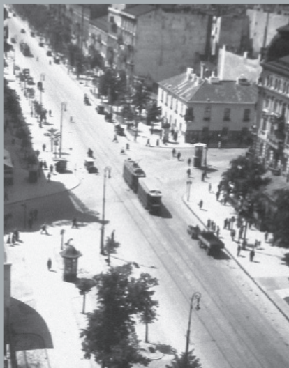
Skrzyżowanie Alei Jerozolimskich z ulicą Bracką. Corner of Jeruzolimskie Avenue and Bracka Street. Kreuzung Allee Jeruzolimskie/ Bracka Straße.

The location of the department store recalls the best pre-war shopping traditions in Warsaw. Between World War I and World War II Bracka was an upscale shopping street. The ground floor of every building along Bracka Street was occupied by first rate Polish and foreign boutiques. The most famous establishments were grouped between Jeruzolimskie Avenue and Chmielna Street. Among the most exclusive was the first modern department store in town – Bracia Jabłkowsky (Jabłkowski Brothers).