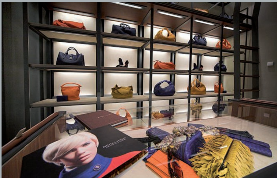
Wnętrze sklepu. Shop interior. Innenraum eines Geschäftes.