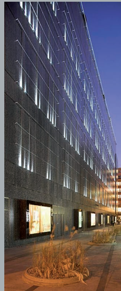
Fasada od strony pasażu. Façade from the side of passage.. Fassade von der Seite der Passage.