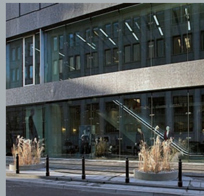
Widok od ulicy Brackiej. View from Bracka Street. Ansicht von der Bracka Straße aus.