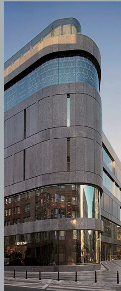
Widok od ulicy Brackiej. View from Bracka Street. Ansicht von der Bracka Straße aus.