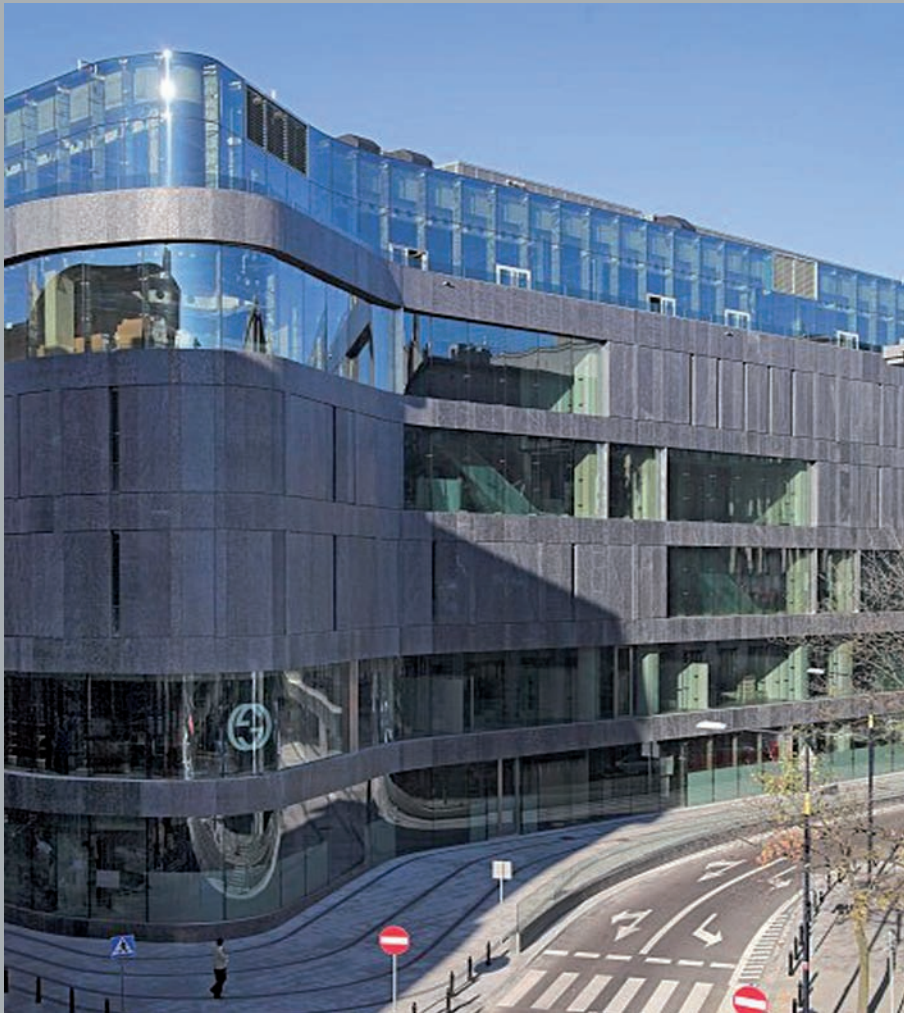
Widok od ulicy Brackiej. View from Bracka Street. Ansicht von der Bracka Straße aus.

Die Lage des Warenhauses knüpft an die besten Vorkriegshandelstraditionen Warschaus an. In der Zwischenkriegsperiode besaß die Bracka Straße auf ihrer gesamten Länge einen Handelscharakter. Die Erdgeschosse sämtlicher Häuser waren durch Geschäftslokale erstrangiger polnischer und ausländischer Firmen belegt. Die berühmtesten Geschäften befanden sich auf dem Abschnitt zwischen der Allee Jerozolimskie und der Chmielna Straße. Genau hier befand sich das Warenhaus der Gebrüder Jabłkowski, das erste exklusive Warenhaus in der Stadt.