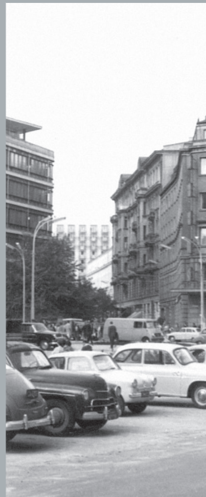
Parking przy ulicy Brackiej. Parking lot on Bracka Street. Parkplatz in der Bracka Straße.