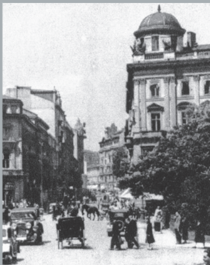
Widok z Placu Trzech Krzyży. View from Trzech Krzyży Square. Ansicht vom Platz der Trzech Krzyży aus.

Lokalizacja domu handlowego nawiązuje do najlepszych przedwojennych tradycji handlowych Warszawy. W okresie międzywojennym ulica Bracka na całej swojej długości miała charakter handlowy. Partery wszystkich domów zajęte były przez lokale sklepowe pierwszorzędnych firm polskich i zagranicznych. Najsłynniejsze sklepy mieściły się na odcinku pomiędzy Alejami Jerozolimskimi i ulicą Chmielną. Tutaj właśnie został zlokalizowany Dom Handlowy Braci Jabłkowskich, pierwszy ekskluzywny dom towarowy w mieście.