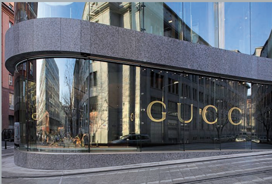
Narożnik od ulicy Brackiej. Corner viewed from Bracka Street. Ecke auf der Seite der Bracka Straße .