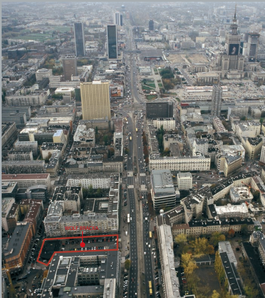
Najbliższa okolica z lotu ptaka. Bird's eye view of neighborhood. Nächste Umgebung aus der Vogelperspektive.

Das Warenhaus Wolf Bracka ist im engen Zentrum Warschau zwischen der Allee Jerozolimskie und dem Platz Trzech Krzyży lokalisiert. In nächster Nachbarschaft befindet sich das riesige modernistische Gebäude der Bank für Landeswirtschaft, das zusammen mit den umgebenden Monumentalobjekten, wie das Bank- und Finanzzentrum, das neue Börsenzentrum und das Nationalmuseum, den Rang und den Charakter des Ortes bestimmt. In der Nähe des Warenhauses verlaufen die prestigeträchtigen Handelsstrecken Warschau: die Straßen Nowy Świat und Chmielna, der Platz Trzech Krzyży, die Allee Jerozolimskie und die Marszałkowska Straße.